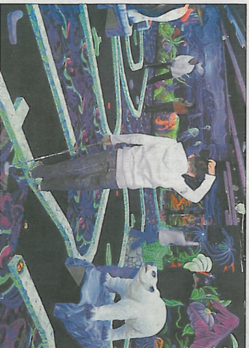
Abrité par le multiplexe Kinepolis, Goolfy est un minigolf d'intérieur, tout en fluo et plein d'animaux.