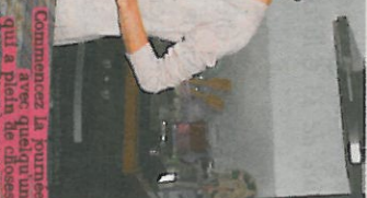
Commencez la journée avec, quand un qui a plein de choses

Place aux jeunes recevez votre journal gratuitement* ! Inscription sur